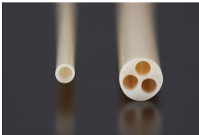
内視鏡部品 (PEEK: ダイセル・エポニック(株))