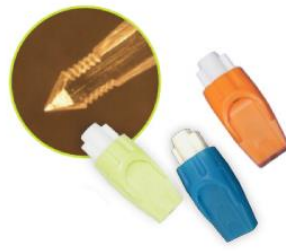
ランセット (PLA: (株)ライトニックス)